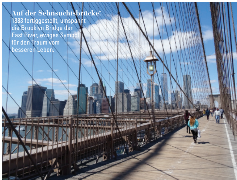
Auf der Sehnsuchtsbrücke! 1883 fertiggestellt, umspannt die Brooklyn Bridge den East River, ewiges Symbol für den Traum vom besseren Leben.