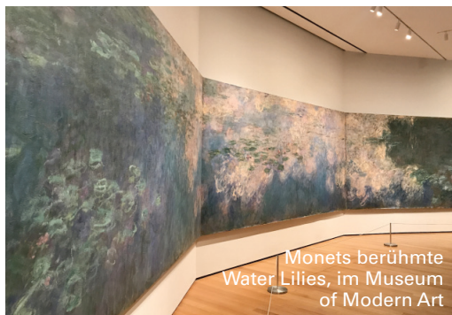
Monets berühmte Water Lilies, im Museum of Modern Art