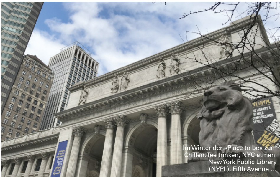
Im Winter der »Place to be« zum Chillen, Tee trinken, NYC atmen: New York Public Library (NYPL), Fifth Avenue ...