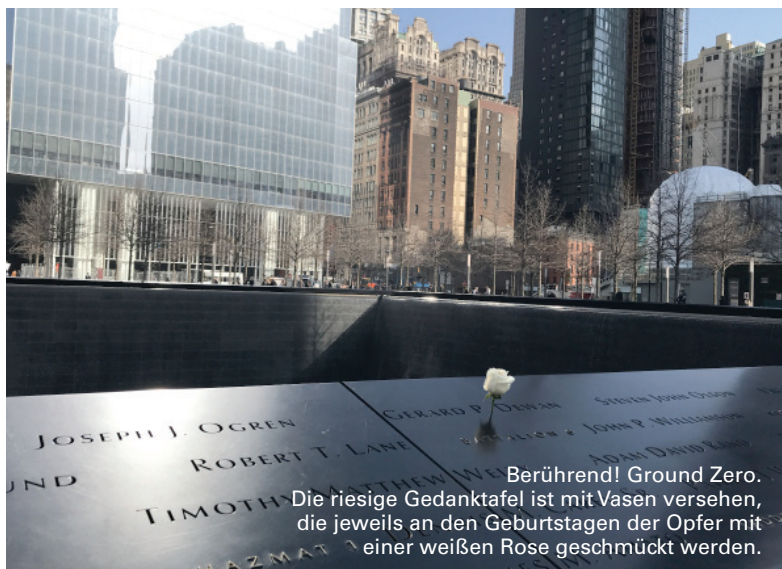
Berührend! Ground Zero. Die riesige Gedanktafel ist mit Vasen versehen, die jeweils an den Geburtstagen der Opfer mit einer weißen Rose geschmückt werden.