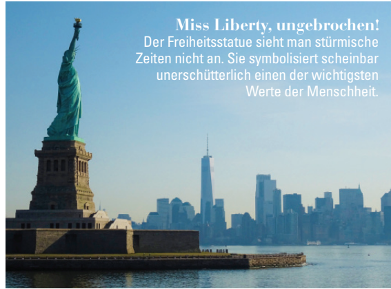
Miss Liberty, ungebrochen! Der Freiheitsstatue sieht man stürmische Zeiten nicht an. Sie symbolisiert scheinbar unerschütterlich einen der wichtigsten Werte der Menschheit.

Skulpturen mit Symbolkraft! Ein furchtloses, fast trotziges anmutendes Mädchen aus Bronze („Fearless Girl“) forderte den angriffslustigen Bullen (Bild unten links) auf der Wall Street heraus. 2017 anlässlich des Weltfrauentags im Zentrum der Geschäftswelt aufgestellt, wurde sie zum totalen Aufreger und fand bald einen neuen Platz – vor der Börse!