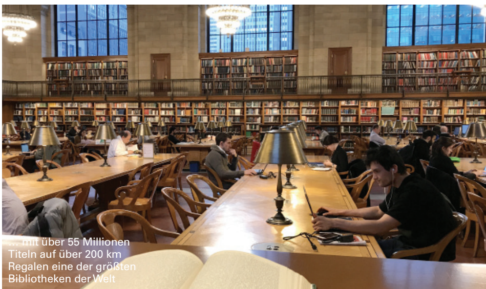
... mit über 55 Millionen Titeln auf über 200 km Regalen eine der größten Bibliotheken der Welt