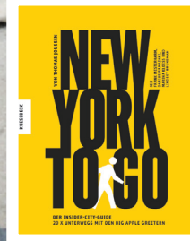
New York to go 20x unterwegs mit den Big Apple Greeters, 2018 Knesebeck 30,80 €

land, New Yorker Hafen! Sie mutet wie eine alte Bekannte an, 1886 eingeweiht, knapp 93 Metern groß, bekanntermaßen ein Geschenk Frankreichs an die Vereinigten Staaten. Die Figur der römischen Göttin der Freiheit (Libertas) hält in ihrer linken Hand eine Inschriftentafel mit dem Datum der amerikanischen Unabhängigkeitserklärung darauf, ihre ergoldete Fackel ragt unbeirrt in den Himmel. Das Drehbuch von Pamelas Reise führt sie anschließend in den Central Park, in die „ Grüne Lunge New Yorks “, wo es nicht unwahrscheinlich ist, einen TV- und Filmstar zu treffen. „So kam mir Comedian Amy Schumer beim Walken entgegen, sympathisch, ungeschminkt. Aber auch ohne eine solche Begegnung ist der unvergleichliche Stadtpark mit seinen Teichen und Brücken eine einmalige Gelegenheit, die New Yorker Seele zu spüren“. Apropos Seele: Die „ Big Apple Greeter “, das sind mehr als 300 waschechte New Yorker, heißen alle Besucher der Metropole persönlich willkommen. In privaten Spaziergängen zeigen sie ihre Stadt (siehe Buchtipps), wie man sie sonst nicht sieht, mir ausgewählten Touren in jedem Viertel, gewürzt mit vielen Insider-Tipps. Go for it!