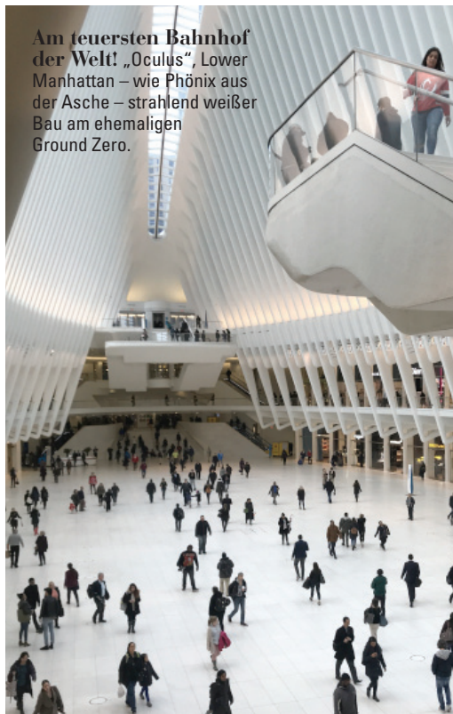
Am teuersten Bahnhof der Welt! „Oculus“, Lower Manhattan – wie Phönix aus der Asche – strahlend weißer Bau am ehemaligen Ground Zero.